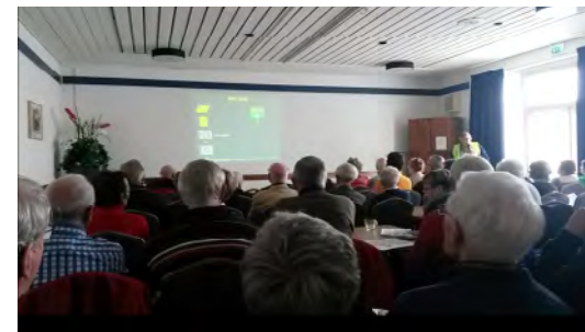
Opfrissen van de kennis van verkeersregels in Veldhoven.