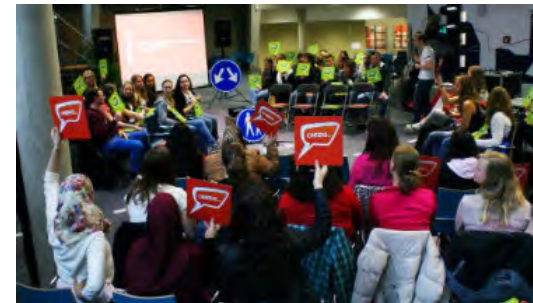
Kruispuntdebat: jongeren debatteren over hun eigen verkeersgedrag.