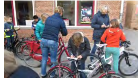
Fietsverlichtingscontrole groep 5 tot en met 8 op de Nutsschool Hertogin Johanna in Oss.