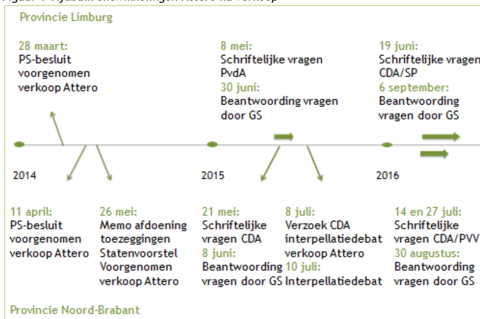
Figuur 1 Tijdbalk ontwikkelingen Attero na verkoop

Deze vragen hebben uiteindelijk geleid tot een verzoek van de Programmaraad van de Zuidelijke Rekenkamer om een onderzoek te doen naar het verkoopproces van Attero 1 . De rekenkamer besloot op 15 september 2016 om een onderzoek hiernaar in uitvoering te zullen nemen.